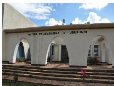
Musée national de Gitega