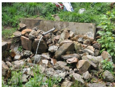
La source du Nil