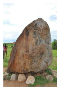
Pierre de Livingstone