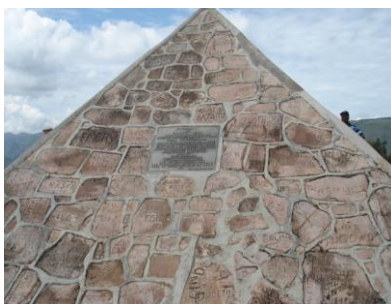
Pyramide de la source du Nil