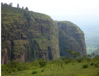
La Faille des Allemands